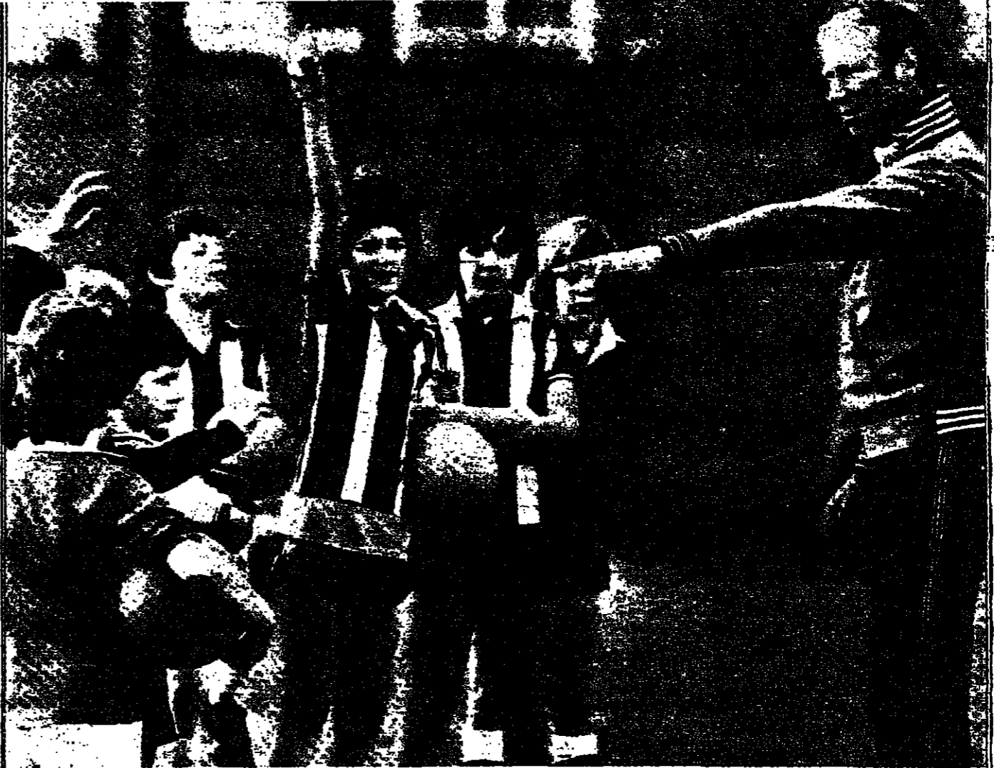
جلكي شارلتون ، مدير نادي شيفلد وينزداي ولاعب منتخب انكلترا سابقا بدأ منذ اسابيع مشروعا لاعداد لاعبي كرة القدم وذلك باعتماده على المواهب الصغيرة .

والرغم من مشاغل شارلتون الكثيرة فانه وكما اعلن . سيعطي من وقته يوما في الاسبوع للعمل على تنمية قابليات الصغار وقد وافق نادي «شيفلد وينزداي» على فتح دورتين تدريبيتين لكل الصغار من هم دون الثالثة عشرة من العمر وسيقوم النادي بتفسيح دورات للصغار من اعمار اخرى .